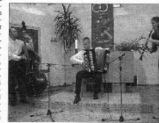
Das polnische Trio „Die Galitziner Klezmerer“ machte das Abschlusskonzert der Reihe „Musik in alten Dorfkirchen“ in Nordhofen zu einem mitreißenden Erlebnis.

Uli Schmidt von der Kleinkunstbühne Hans Taber erzielte bei der Besetzung der Gäste in der gut gefüllten Nordhofener Kirche. Wie bei den letzten beiden „Waldreisen“ durch die Kulturreise „Eine Waldreise“, die nur durch die Unterstützung unserer Redaktionsleiter und Sponsoren zu einem Erfolg werden konnte. Ein Erfolg, der mittlerweile die Dorfkirchen in der Region aus den Nähten platzen lässt. „Musik in alten Dorfkirchen“ hat Chorus und SOI und hat sich in der anspruchsvollen Kulturreise im Westerwald etabliert.